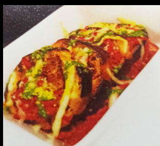
Gratin d'aubergines grillées

Sauce à la tomate & Emincé de Viande, Emmental et Parmesan.