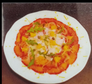
Duo carpaccio de saumon, et poisson blanc

Fenouil, Orange, Câpre, Aneth, Huile de sésame et Feuille de coriandre