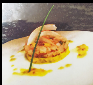
Tartare de capitaine

Avocat, Pommes vertes, Pétales noix de coco, Compotée d'ananas passion.