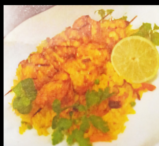
Brochette de poulet à l'indienne.

Riz façon biryani, Raisins secs, Feuille de menthe & Coriandre.