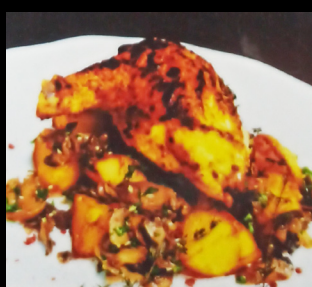
Poulet grillé à la moutarde

Pommes de terre grillées, Champignons sautés, Thym frais