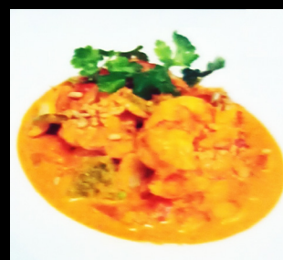
Curry aux gambas

Sauce curry rouge, Carottes, Petits pois, Poivrons, Ananas. Accompagné de riz basmati