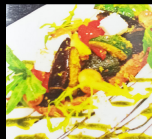
Tartine à l'italienne

Pain à l'avoine, Tapenade d'olives noires, Légumes grillés, Feuilles de roquettes, Tomates cerises et féta.