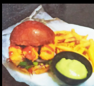
Burger au poisson pané,

Choux rouge, Oignons, Feuilles de coriandre et Sauce wasabi. Accompagné de pommes frites